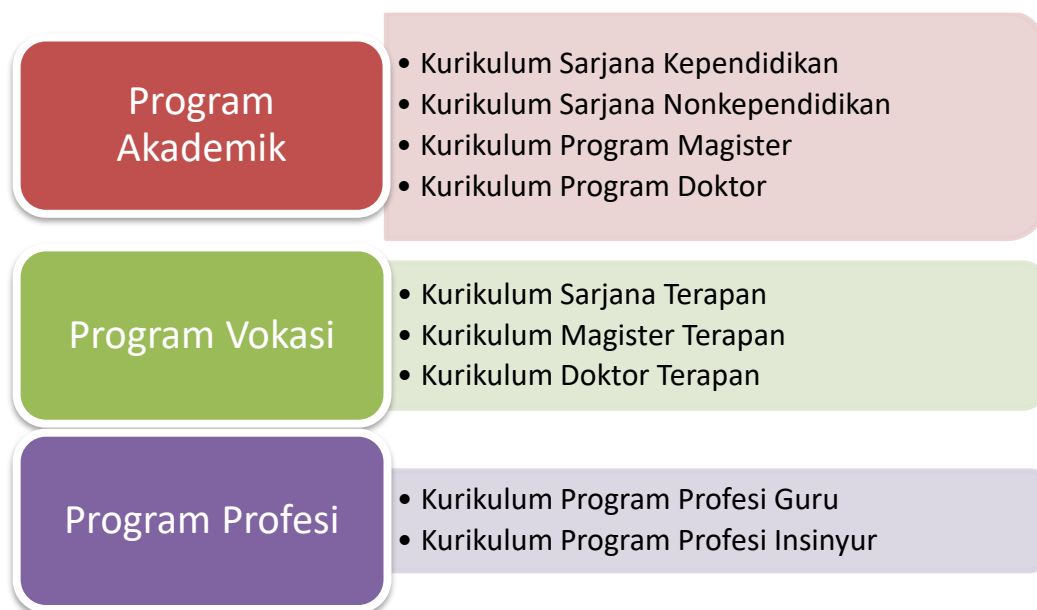
Gambar 2. Model Kurikulum UNY

Kurikulum Universitas Negeri Yogyakarta terdiri dari program akademik, program vokasi, dan program profesi. Model kurikulum dijelaskan pada Gambar 2.